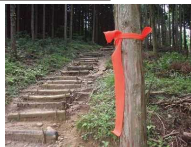
オレンジ色の誘導マーク

ゴールと同時に自動でタイムが計測されます 第1関門 (12km, 第2エイド) 13:00 ゴール閉鎖 14:30 (ゴール閉鎖時刻以降はコースを走れません)